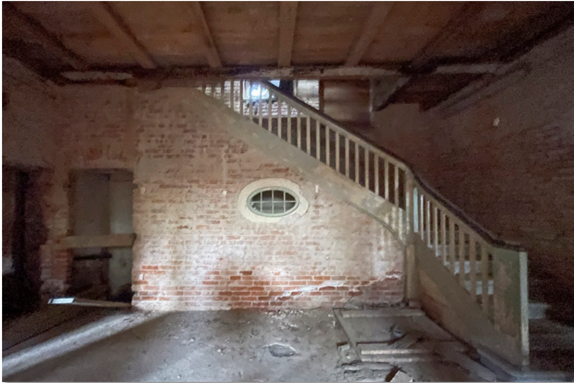
Das Verwalterhaus – von innen